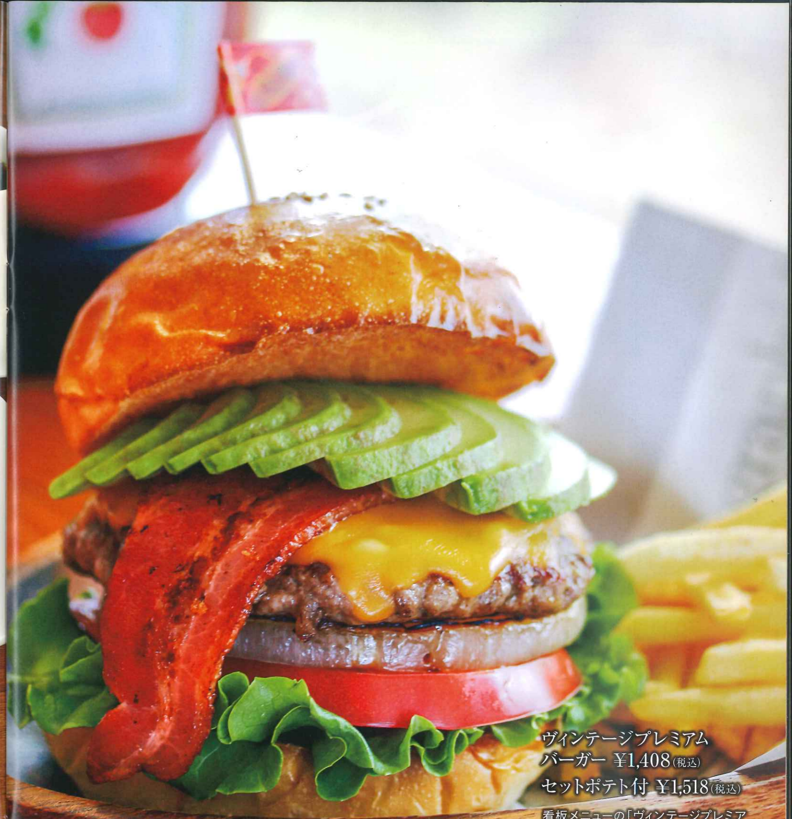
ヴァンテージプレミアム バーガー ¥1,408(税込) セットポテト付 ¥1,518(税込)

看板メニューの「ヴァンテージプレミアムバーガー」には、秘伝のスパイスで味付けした手捏ねパテにローストオニオン・厚切りベーコン・フレッシュアボカドがたっぷり。それぞれの素材が合わさり、美味しさが口の中いっぱい広がる一品です。