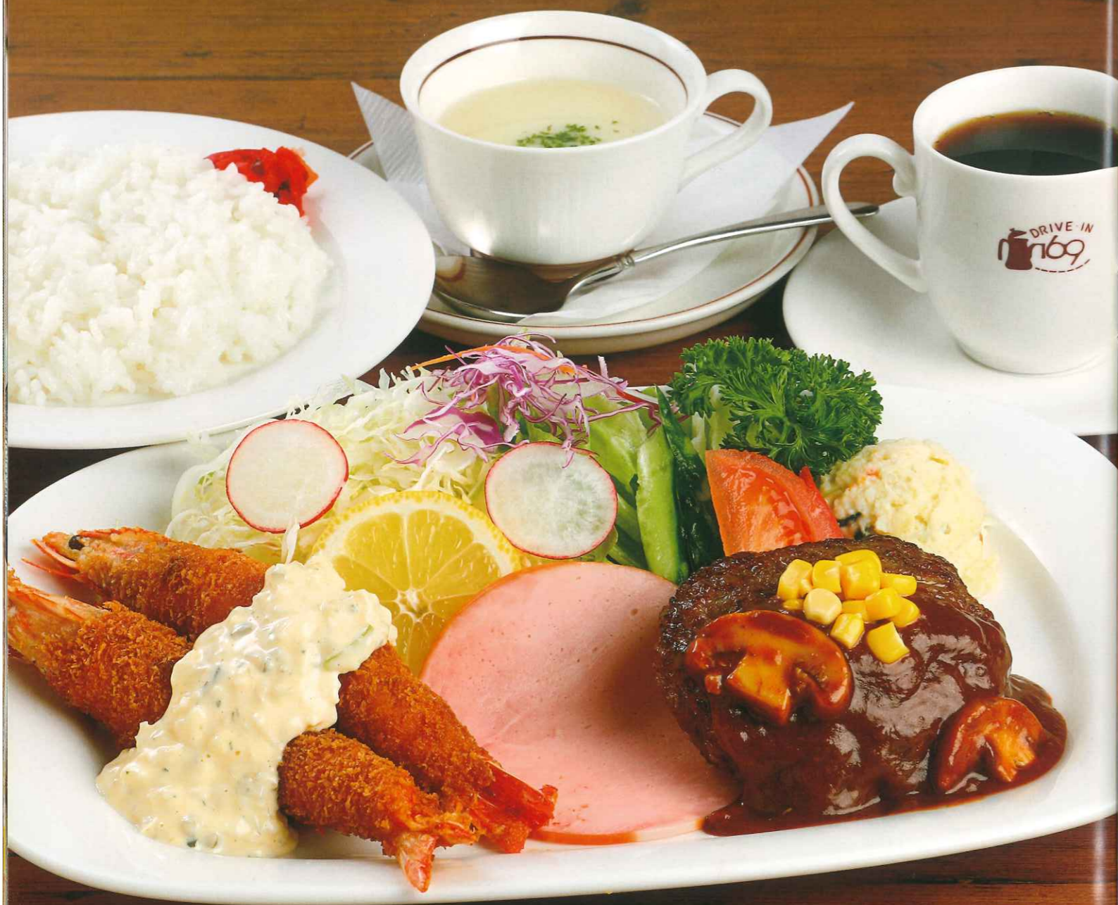
169ランチセット ¥1,800(税込) (ポタージュ・コーヒー付)